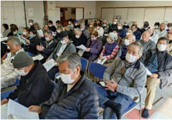
波田地区懇談会 会場がほぼ満席となる92名の会員が参加。担当理事の説明に皆さん真剣に耳を傾けていました。