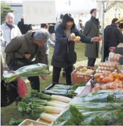
手づくり新鮮野菜の販売