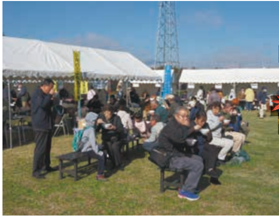
ふるまいの豚汁に多くのお客様が舌つづみ

第17回シルバーまつり開催 11月9日(土)にセンター及びセンター芝生広場で第17回シルバーまつりが開催されました。今年のテーマは「会員手づくり秋の収穫祭」。快晴・無風、穏やかな秋空のもと、新鮮野菜やりんごを目当てにご来場いただいた、大勢のお客様でにぎわいました。