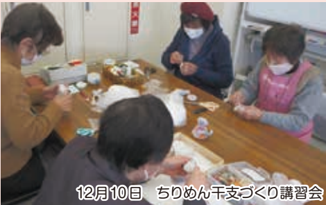
12月10日 ちりめん干支づくり講習会

已年生まれは辛抱強く、粘り強い性格で知恵・洞察力に優れているといわれます。福趣会の皆さんは、根気よく手を動かし針を器用に使って、毎年干支の置物を作り販売しています。