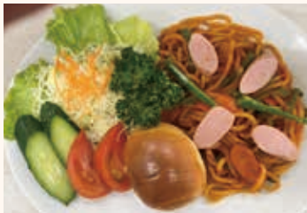
人気のパスタランチ