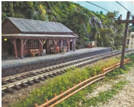
精巧に作られた、駅舎と鉄路。細部まで再現されて本物のようです。

最初は難しいと思ったけれど、ぐらぐらしているよりは良いと思いき、ホームセンターで発泡スチロールを2枚、レール、電車を買い、なるべく安くするため百円