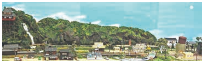
会員互助会作品展に展示した鉄道ジオラマの全景

シヨップでも材料を買い作り始めました。家は百円シヨップの爪楊枝で、地面は川から砂利をふるいにかけて粒をそろえて撒いて地面としました。いざ作っていかると結構大きくなって畳2枚くらいまで作っている