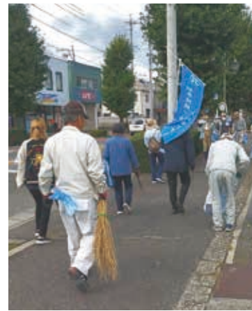
松南地区一斉奉仕活動