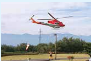
長野県防災ヘリコプター飛来