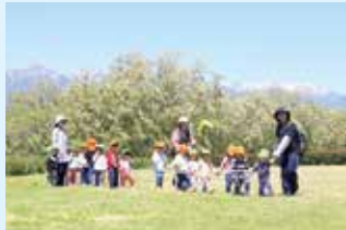
白板保育園お散歩