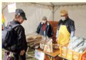
会員による山形村産・長芋の出店

11月初旬に開催予定のシルバーまつりへの個人出店者を募集します。昨年は8名の会員さんに、自家栽培の野菜や木彫、手作り工芸品などを出店いただきました。