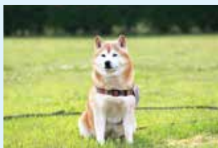
毎日散歩に来る会員さんの愛犬