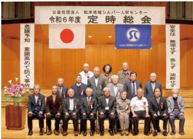
表彰式に出席された皆さん

定時総会の席上、役員として2期4年以上にわたり、センター事業の運営にご尽力され退任された3名の方の役員功労表彰、就業実績の他、奉仕活動、地区懇談会にも積極的に参加されるなど、会員としてセンター事業の発展に寄与し、その業績が顕著な方28名と、新規会員を二人以上紹介いただき、会員増の取り組みに功績のあった方2名の方々が表彰されました。