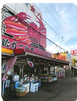
角上魚類の本店がある寺泊市場

地震の疑似体験と、被災から復興までの道筋をたどることで「備える」大切さを伝える小千谷市ミュージアムや、仕事運とか縁結びのパワースポット彌彦神社など見どころも一杯あり、道中も飽きることはありません