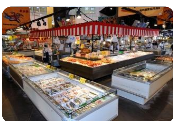
新潟ふるさと村で新鮮なお魚を