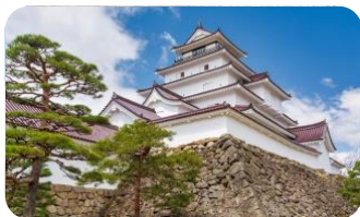
会津若松市鶴ヶ城